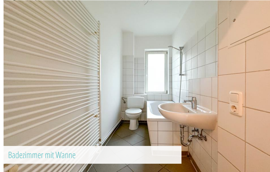
Badezimmer mit Wanne